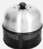
Parrilla Compact Black