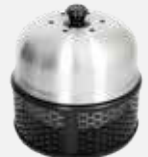
Parrilla Compact Black